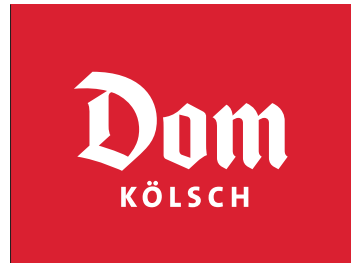
Dom Kölsch_Logotype weiss