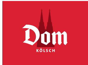
Dom Kölsch_Logotype mit Dom