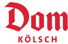
Dom Kölsch_Logotype rot