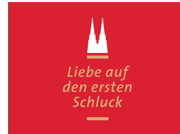
Dom Kölsch_Claim negativ