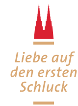
Dom Kölsch_Claim positiv

Alle Logovarianten können auf rotem und weissem Fond eingesetzt werden. Der Einsatz auf rotem Fond wird bevorzugt.